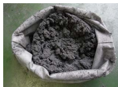
研削SK材スラッジ(脱水後)