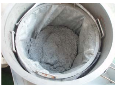
研削アルミスラッジ(脱水後)